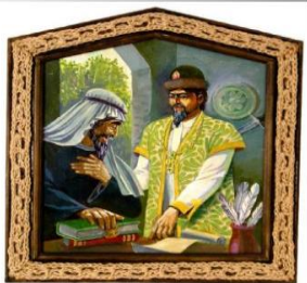
Кубрат - основатель Великой Болгарии и его сын Кодрак.

• В VII веке тюркоязычные болгары создали свое государство - Великую Булгарию - на территории от Кубани до Днепра. Из-за поражения в войне с Хазарским каганатом часть болгар переселилась на Дунай, в дальнейшем там возникает государство - Болгария. Другая часть болгар переселилась в Среднее Поволжье - на Волгу и Каму и образовала в IX веке Волжскую Булгарию. С 922 г. официальная религия - ислам .