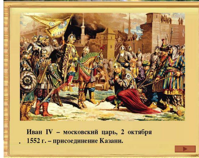
Иван IV - московский царь, 2 октября 1552 г. - присоединение Казани.